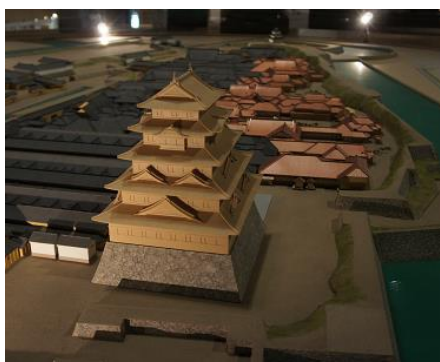
江戸城寛永度天守