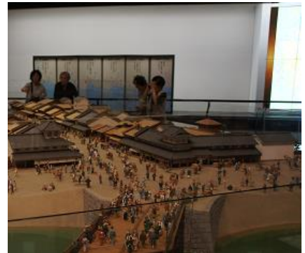
日本橋のジオラマ