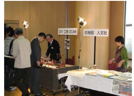
DIY工房 IZUMI (左) 栞人文社 (右)