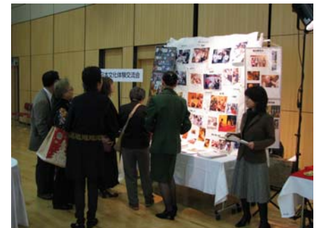
日本文化体験交流塾