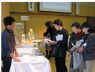
斉藤秀夫城郭巡りの旅